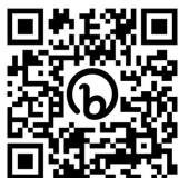
募集情報詳細・応募フォーム